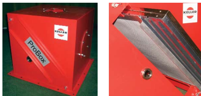
Pare-flamme avec pré-séparateur de copeaux intégré

Possibilités d'installation sur la machine ou dans la tuyauterie